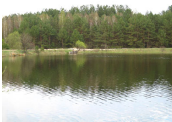
Фото: Озеро Доманово.

Примечательно, что списки жителей Селечни имеются в описаниях Прикладенской волости Брянского уезда 1645-1677 гг., расположенной на территории современного Клетнянского района. Первая строка описания преподносит нам ещё одно открытие: «Село Селечня, что был починок Домонове пересилили с старого селища на речке Селеченке». (Изложено по книге Крашенинникова В.В. История Севска и окрестных мест. тт.1. – Брянск, 2013). В нескольких километрах от Селечни имеется урочище Доманово, упоминавшееся в документах 1603 г., которое после событий Смутного времени исчезает.