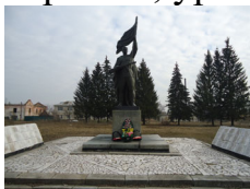
Фото: Мемориальный комплекс «Воину-освободителю» в с. Селечня.

Вечная слава героям: погибшим, умершим, и живым! В Селечне воздвигнут памятник «Воину - освободителю» по проекту заслуженного скульптора Украины, уроженца Селечни - Горовых Ивана Семѳновича.