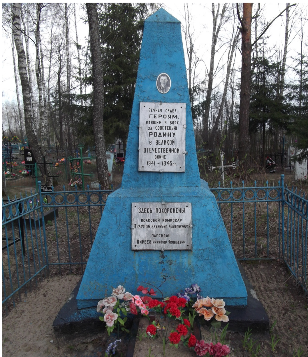
Братская могила воина и партизана