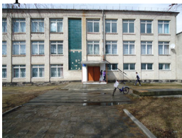
Фото: Здание Селеченской школы.

При нём началось интенсивное строительство. Была приобретена дизельная электростанция, колхозное производство подверглось электрификации. В тот же период все дома были радиофицированы, позже началась телефонизация. С 1965 г. пошло бурное строительство на селе. Построили водонапорную сеть с водонапорной башней на колокольне церкви. Колхозники стали пользоваться водой из колонок. Появилась пилорама. В 1969 г. вошла в эксплуатацию трёхэтажная школа, построена центральная котельная с теплотрассой.