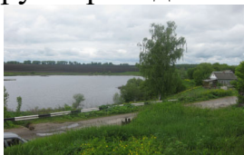
Фото: Павловичи: вид на озеро. Наши дни.