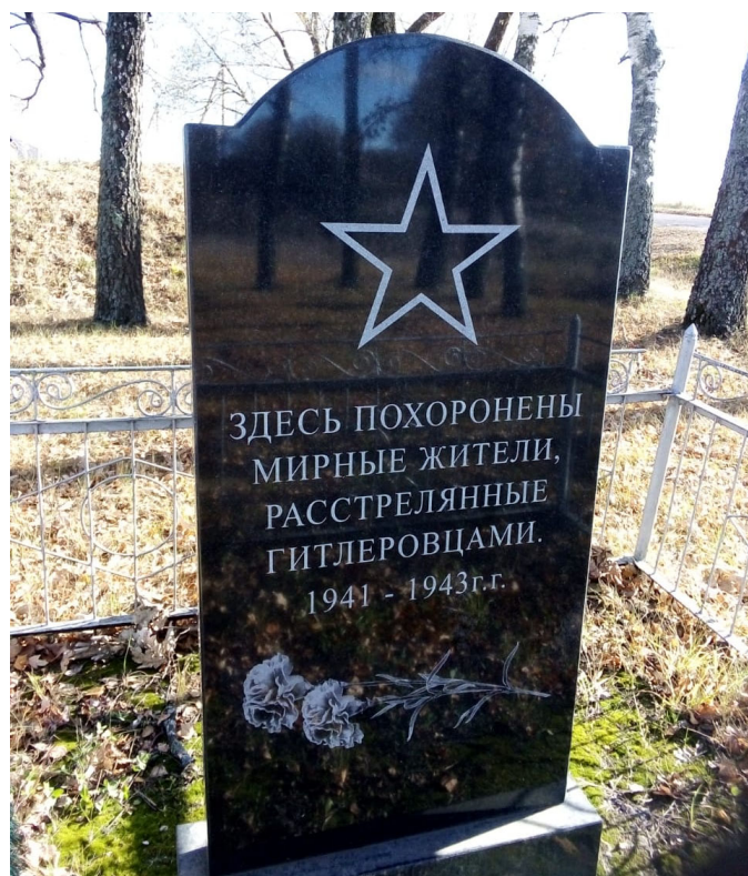
Братская могила 32 советских воинов, погибших в боях с немецко-фашистскими захватчиками.

25 марта 1942 г. отряд мадьяр, по пути из Севска в Середино-Буду, напал на село Павловичи. Всех не успевших укрыться мужчин и некоторых женщин согнали на пригорок около села и расстреляли из пулемета. Когда погибшие и раненые упали, мадьяры обратились к упавшим со словами: "Эй, паны, матки, марш по хатам!" Раненые, поднявшие головы и начавшие шевелиться, были тут же пристрелены. Из находившихся в толпе 45 человек были убиты 33, тяжело ранены 8, остались невредимыми 4 человека (из акта Суземской районной комиссии от 10 мая 1944 г.). Ночью жители деревни подобрали убитых и захоронили их в братской могиле возле школы. Братская могила 34-х мирных жителей, расстрелянных фашистами, находится в д. Павловичи в сквере возле начальной школы. На мраморных досках, на территории комплекса, также выбиты имена жителей села, погибших на фронтах Великой Отечественной войны.