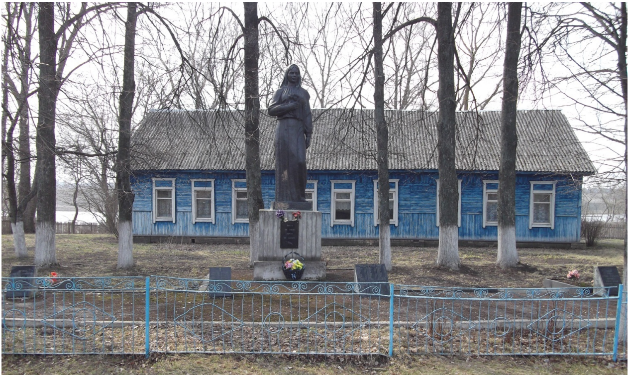
Памятник «Скорбящая мать»

Мемориальный комплекс села Павловичи, расположенный в сквере начальной школы, представляет из себя, комплекс обелисков и пилонов с мемориальными мраморными досками. В центре – скорбящая фигура женщины-матери, изготовленная из меди, на невысоком постаменте. Высота фигуры 3 метра. Скульптор И.С. Горовых. Также в комплекс входит памятник 19 воинам, погибшим при освобождении села. На территории комплекса находится братская могила 34 мирных жителей, расстрелянных фашистскими карателями 25 марта 1942 г.