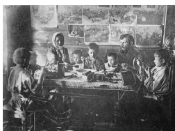
Фото: Крестьянская семья за обедом. Фото конца 19 в.

В 1866 г. такой источник как «Список населенных мест Орловской губернии» говорит: «Павловичи, село казенное, Севского уезда, по правую сторону от большой Новгород-Северовой дороги от города Севска в город Новгород-Северск, при речке Таре, расстояние от уездного города 23 версты, число дворов 94, число жителей мужского пола 304, женского пола 320, всего 624 человека. Церковь православная».