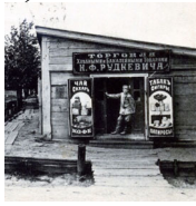
Фото: Типичная сельская торговая лавка до революции.

По данным издания «Волости и важнейшие селения европейской России» (СПб., 1880 г.) в селе было свое волостное правление, лавка.