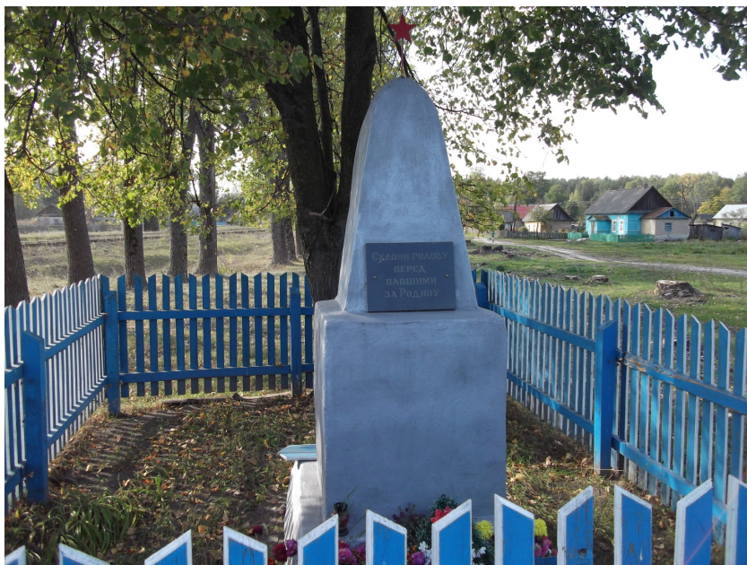
Пос. Новенькое, Братская могила 9 советских воинов.

Теперь, наверное, уже не так важны фамилии, как просто сам факт существования могилы. Здесь лежат не сломленные, не побежденные врагом, сильные духом русские воины, в безнадежной ситуации оставшиеся верными долгу и присяге.