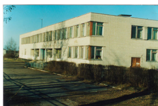
Фото: Кокоревская школа сегодня.

В 1978 г. было построено новое здание школы, в которой уже много лет работает крепкий и творческий коллектив.