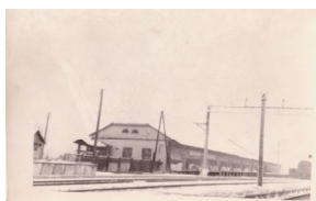
Фото: станция Кокоревка.

В кон. 19 - нач. 20 вв. по северу и востоку Трубчевского уезда прошли две железнодорожные линии: Брянск - Гомель и Навля - Конотоп. Новых крупных поселков при них не появилось, но такие селения, как Выгоничи, Алтухово, Кокоревка, Суземка, Холмечи, где возникли станции, начали развиваться быстрее.