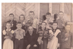
Фото: Ученики Кокоревской школы. Довоенное фото.