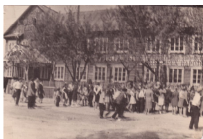
Фото: Кокоревская школа после войны.

Но только в 1950 г. открылась новая семилетняя школа на 280 мест и тогда же была преобразована в среднюю. Из года в год росло число классов и учащихся. Обязательным стало семилетнее образование, в 8-е классы нашей школы стали поступать ученики из ряда соседних сел Суземского, Брасовского и Навлинского районов. В этом же здании несколько лет подряд в третью смену занималась школа рабочей молодежи. С 1953 г. школа начала выпускать десятые классы. Многие из выпускников окончили ВУЗы, аспирантуру и получили ученую степень и работали в разных отраслях народного хозяйства и научно-исследовательских институтах. 17 учителей имеют правительственные награды.