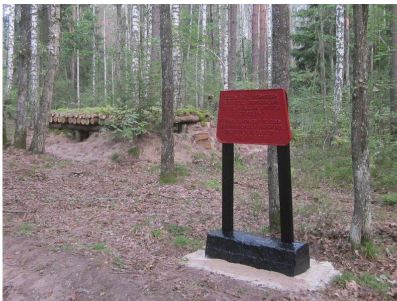
Землянка, штаб партизанского отряда «Большевик»