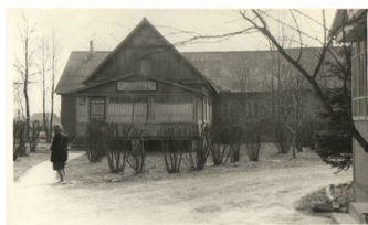
Фото: Участковая больница в п. Кокоревка. Послевоенное фото.

Только церковь долго не возрождалась из руин. Со временем на ее месте был построен клуб. В 1945 г. в поселке был открыт медпункт, который первое время помещался в землянке, а больных обслуживали на дому.