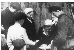
Фото: Подписка на военный займ среди жителей Кокоревки. 1942 г.