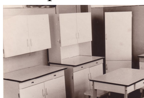
Фото: Кокоревская мебельная фабрика. Продукция предприятия в 1950-1970-х гг.

В декабре 1968 г. на Кокоревском комбинате был сдан в эксплуатацию новый лесопильный цех: каменное двухэтажное здание, оборудованное современными станками. Старейшим цехом на комбинате остается деревообрабатывающий. ДООЦ выпускал самую разнообразную продукцию, являвшуюся сырьем для работы других цехов комбината. Ассортимент выпускаемой продукции разнообразен: половой брус, строганный пиломатериал, специальная упаковка для военного завода, дверные полотна, оконные переплеты и др.