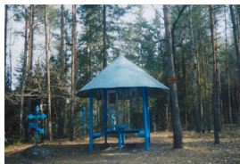
Фото: Урочище «Монахи» близ Кокоревки.

сосновом бору, они долгое время прожили около Кокоревки. После их смерти поселение на том месте построило часовню, где из старого пня бежал родник. Это место считали святым. Его так и стали называть – «Монахи».