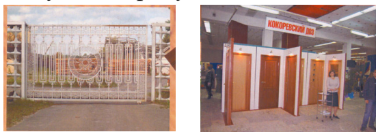
Фото: Кокоревский ДОЗ. Наши дни.

поселка 100 рабочих мест. К 2004 г. руководство Кокоревского ДОЗ, изучая конъюнктуру рынка, приходит к выводу, что заниматься только обработкой древесины нерентабельно, рациональнее изготавливать пользующуюся повышенным спросом продукцию. И к 2006 г. рождается новое предприятие ООО «Русские двери». На площадях фирмы расположились деревозаготовительный цех, цех первичной распиловки, сушильное хозяйство, деревообрабатывающий, производственный и лакокрасочный цеха. Теперь на предприятии используется оборудование германских фирм WEINIG, FRIZ, PAUL и др., что позволяет выпускать продукт с высокими качественными характеристиками.