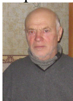
Фото: Дроздов Юрий Семёнович. Наши дни.

Жители Холмечей воевали с немецко-фашистскими захватчиками в составе партизанских отрядов им. Калинина, им. Пожарского и отряда «Большевик». Освобождение посёлка и округи пришло с контрнаступлением советских войск в результате победы на Курской дуге. 7 сентября 1943 г. п. Холмечи, деревни Теребушку, Неруссу, Чернь и п. Кокоревку освободила от оккупантов 250-я стрелковая дивизия. (После освобождения Белоруссии в 1944 г. она станет известна как Бобруйская Краснознамённая ордена Суворова 2-й степени дивизия). Сразу же после освобождения началось восстановление станции Холмечи, через неё вновь пошли поезда. В 1946 г. восточная сторона посёлка (вокзал и ж.д. инфраструктура, домовладения) были обеспечены электричеством. Для этого построили здание маленькой ТЭС, работающей на сжигании дизельного топлива. Она располагалась сразу за радиорелейной станцией (здание стоит до сих пор). Работало два-четыре дизеля, один был от американского катера. Западная сторона тоже была обеспечена электричеством. В кирпичном здании тарного цеха (сейчас там размещается церковь) работал паровой двигатель (локомобиль), который приводил в действие генератор. Вырабатывалось всего 60 кВт электроэнергии. Машинистами работали здесь Усиков Дмитрий и Капанин Пётр. Перед призывом в армию работал здесь кочегаром и Дроздов Ю.С.