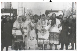
Фото: Проводы зимы: Масленица. Массовое гуляние жителей п. Холмечи. Конец 1960-начало 1970-х гг.

В народе были популярны праздники и массовые гуляния «масленица», на дни железнодорожника и работников лесного хозяйства.