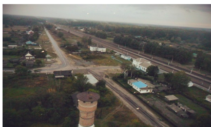
Фото: Вид п. Холмечи с высоты 50 м.