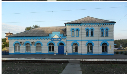
Фото: Холмечи: вокзал ж.д. станции.

Посёлок Холмечи изначально возник в конце 19 в. на месте работы артели лесорубов из деревни Холмечь (сейчас в Брасовском районе) и рос вместе с развитием лесозаготовок и строительством железной дороги Навля - Конотоп в 1897 г. Первый поезд по линии Москва-Брянск-Киев, а значит, через Холмечи, прошел в 1899 г. Поначалу на месте будущего посёлка стояло всего 7 избушек. Близлежащие земли и леса принадлежали богатому владельцу из царской семьи великому князю Михаилу Александровичу Романову, брату царя Николая II.