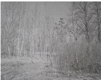
Фото: Место Троицкого храма в д. Денисовка. 2013 г.

Центром общественной жизни в селе тогда всегда была церковь. До постройки в 1862 г. деревянного храма во имя Троицы Живоначальной Денисовка была деревней - вероятно, в приходе Красной Слободы, а с 1862 г. - село с деревянной Троицкой церковью (закрыта в 1930-х гг., не сохранилась). Храм построен в 1862 г. на средства прихожан и освящён во имя Пресвятой Троицы. Одноглавое здание церкви со старинным иконостасом было единственным за всю историю села. До начала 20-го века храм не раз подвергался небольшому ремонту. Храм стоял на каменном фундаменте, снаружи был обшит тёсом и окрашен масляной краской, не отапливался. К нему примыкала двухъярусная колокольня с пятью колоколами, высотой 13 метров, вместе с которой общая длина храма составляла 21 метр, а ширина - чуть менее 10 метров. В церкви насчитывалось 12 окон. Церковная территория была окружена деревянной оградой длиной 140 метров. В 1870-х гг. Троицкая церковь была ненадолго приписана к Преображенской церкви села Негино.