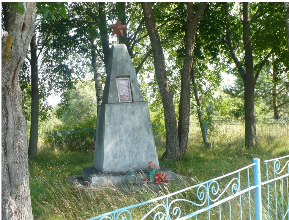
Братская могила 28 воинов советской армии.

Братская могила воинов Советской армии, погибших в борьбе с немецко-фашистскими захватчиками, находится на окраине села Денисовка, на высоте, 150 м. южнее реки Нерусса.