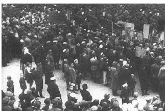
Фото: 1930-е. Собрание колхозников дд. Денисовка, Смелиж и др.

В ходе революционных событий 1917 г., в гражданскую войну, в 1920-е и 1930-гг. Денисовка испытала все те же тяготы, что и окрестные сёла. В начале 1930 гг. в Денисовке появился одноименный колхоз, лесничество.