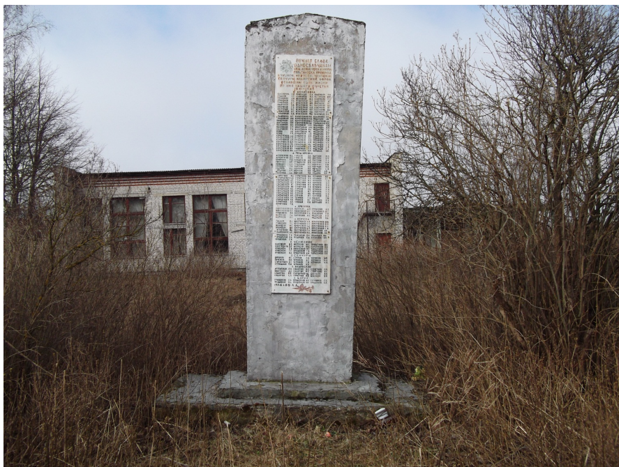
Стела памяти земляков.

Стела памяти установлена у сельского клуба, который сейчас уже не функционирует. На стеле имеется текст: «Вечная слава односельчанам села Денисовка деревень Герасимовка, Криничка посёлков Нерусса, Челюскин, Сенчуры, Ильинский, Борок отдавшим свои жизни во имя нашего счастья. 1941 – 1945» и перечислены фамилии не вернувшихся с войны.