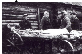
Фото: Сбор продовольствия для партизан в Суземском районе. 1941-1943 гг.

Калахины, Радистовы (по профессии), Костиковы, Палагины (по имени), Коротыши и Безрукие (по внешним признакам). Война внесла свои коррективы.