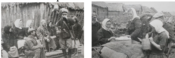
Фото: 1942 г. Партизаны в д. Чернь. Сбор продовольствия для партизан жителями д. Чернь.

Край, в котором восстановилась советская власть, а это значит шла обычная мирная жизнь, охраняли свои поселения - создавали отряды самообороны, помогали партизанам.