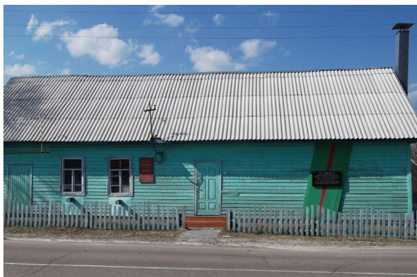
Сельский клуб, с памятной доской.

Здесь, в д. Берёзовка, в ночь с 6 на 7 ноября 1942 года впервые прозвучала песня Анатолия Софронова и композитора Сигизмунда Каца «ШУМЕЛ СУРОВО БРЯНСКИЙ ЛЕС», ставшая гимном Брянской области. Песню исполнил у партизанского костра сам поэт, прилетевший в тыл врага. Это был подарок авторов брянским партизанам.