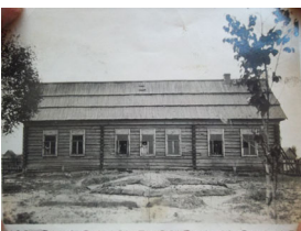
Фото: Здание школы в д. Берёзовка. 1950-1960-е гг.