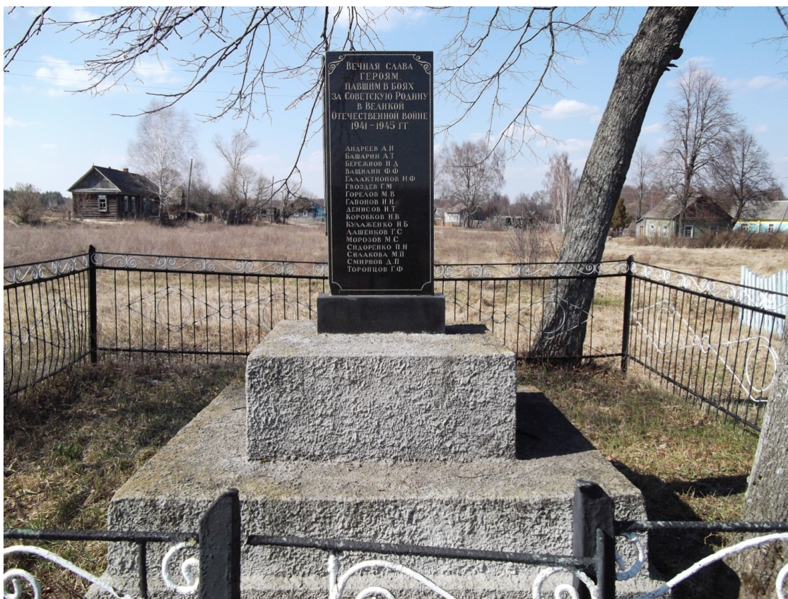
Братская могила 17 воинов советской армии и партизан.

В д. Берёзовка находится Братская могила 17 воинов и партизан, погибших за нашу Родину. Так же Берёзовка оспаривает у Смелижа первенство исполнения песни «Шумел сурово Брянский лес», ставшей впоследствии гимном Брянской области.